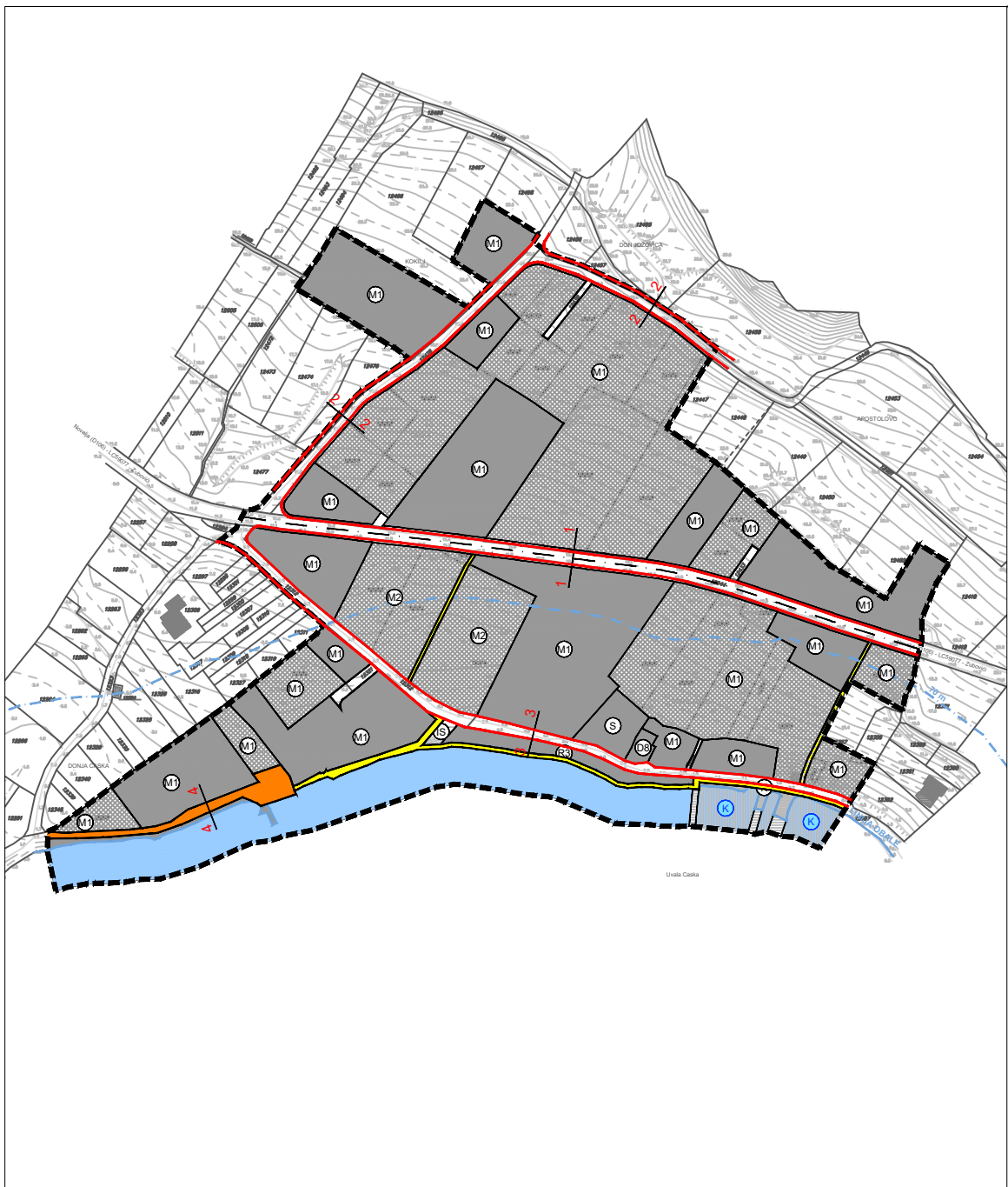
KARAKTERISTIČNI POPREČNI PRESJECI CESTA MJ 1:100